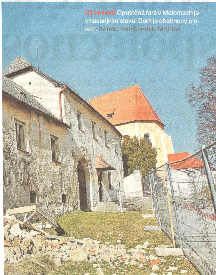
Už se bortí Opuštěná fara v Malontech je v havarijním stavu. Dům je obehnaný plotem.

Až symbolickým počinem se tak stává iniciativa desítek lidí z Čech